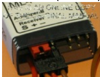
Blinker/indicator Manual Off: Position A (links/left)